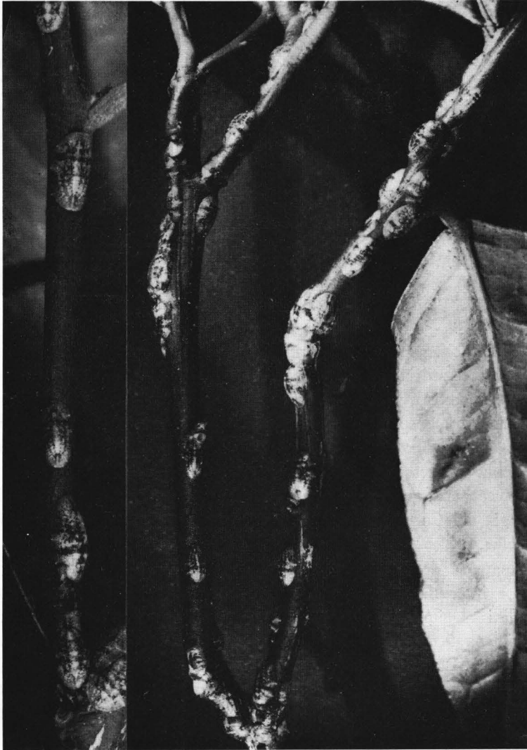
Fig. 2 - C. pseudomagnoliarum (Kuw.). Rametti di arancio fortemente infestati dalla cocciniglia.

Nella nostra Isola, dalle ricerche effettuate, risultano infestate sinora i contigui comprensori agrumetati di Palagonia e Mineo, posti nella plaga agrumicola a sud-ovest della Piana di Catania. Sinora non si è a conoscenza di eventuali altri focolai nell'Isola e sarebbe auspicabile, da parte degli agrumicoltori e dei competenti Organi tecnici, intervenire con mezzi drastici di lotta per tentare di ostacolare e circoscrivere tempestivamente l'ulteriore diffondersi