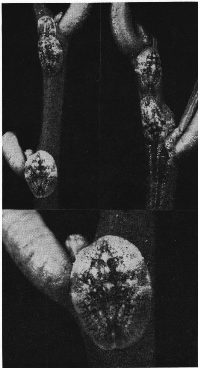
Fig. 4 - C. pseudomagnoliarum (Kuw.). In alto : porzioni di rametti di arancio attaccati da alcuni esemplari della cocciniglia; in basso : femmina adulta a maggiore ingrandimento.