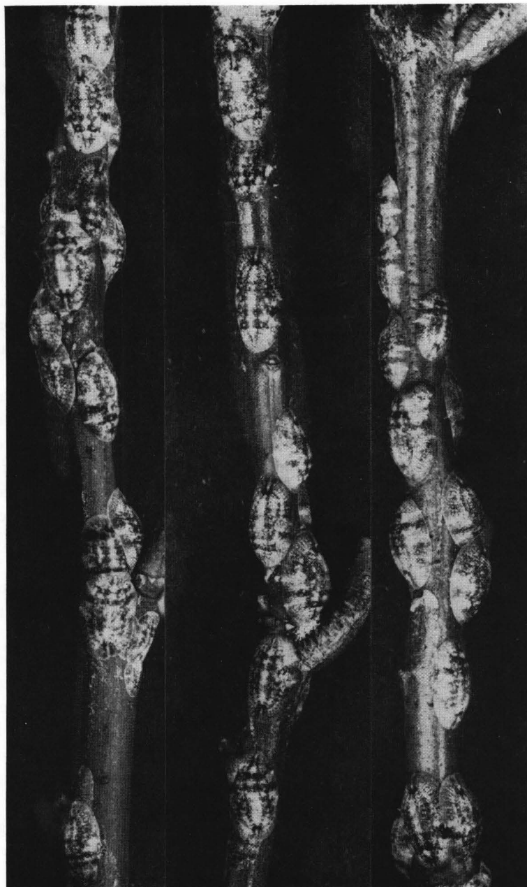
Fig. 3 - C. pseudomagnoliarum (Kuw.). Particolare di altri rametti di arancio fortemente infestati.