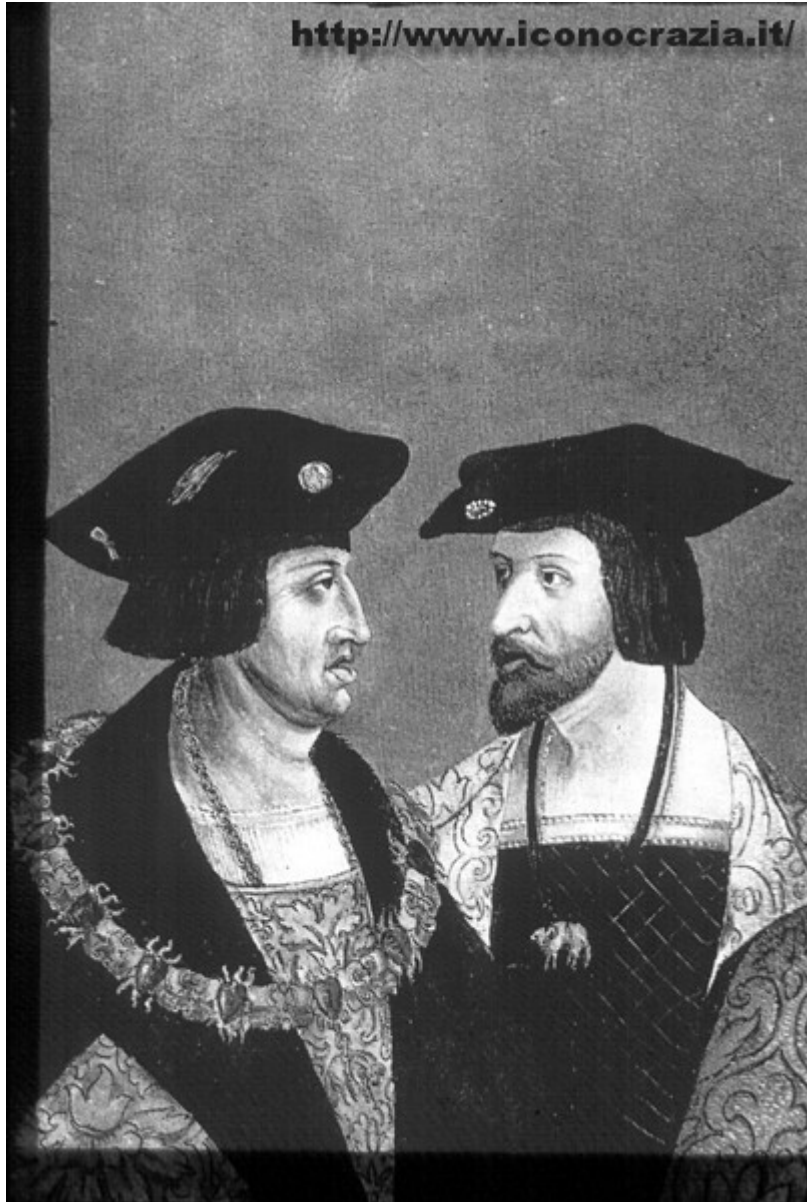
Figura 03. Massimiliano I e Carlo V (f/f) Hieronimus Beck (XVI sec.)

Nella figura 04 (1529), un rilievo in alabastro, ancora i due imperatori 'faccia a faccia'.