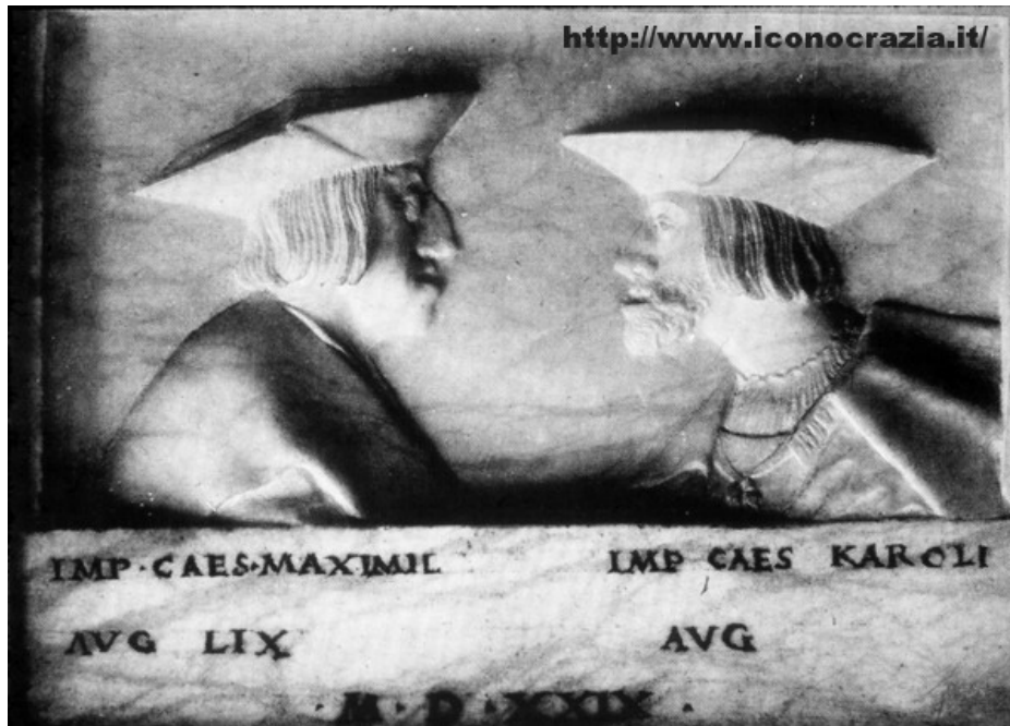
Figura 04 Massimiliano I e Carlo V (f/f) Bassorilievo in alabastro di Loy Hering (1529)

3. Nel terzo tipo ho raggruppato tutti e tre gli imperatori (Massimiliano I, Carlo V e Ferdinando I), ma sono rappresentati nella prima medaglia ‘faccia a faccia’, nelle altre due ‘collo a collo’.