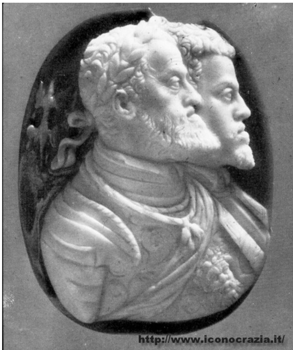
Figura 017. Carlo V e il Principe Filippo II (n/n)Cammeo di Leone Leoni