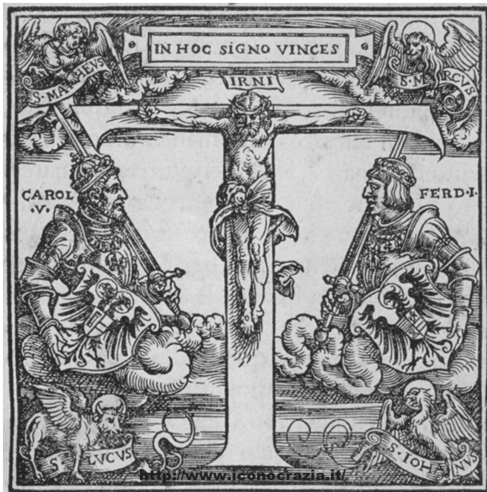
Figura 08. Ferdinando I e Carlo V ai piedi della croce

07 e 05, ma ricorda anche l'uso tipicamente romano di rappresentare nelle medaglie gli imperatori con le proprie mogli.