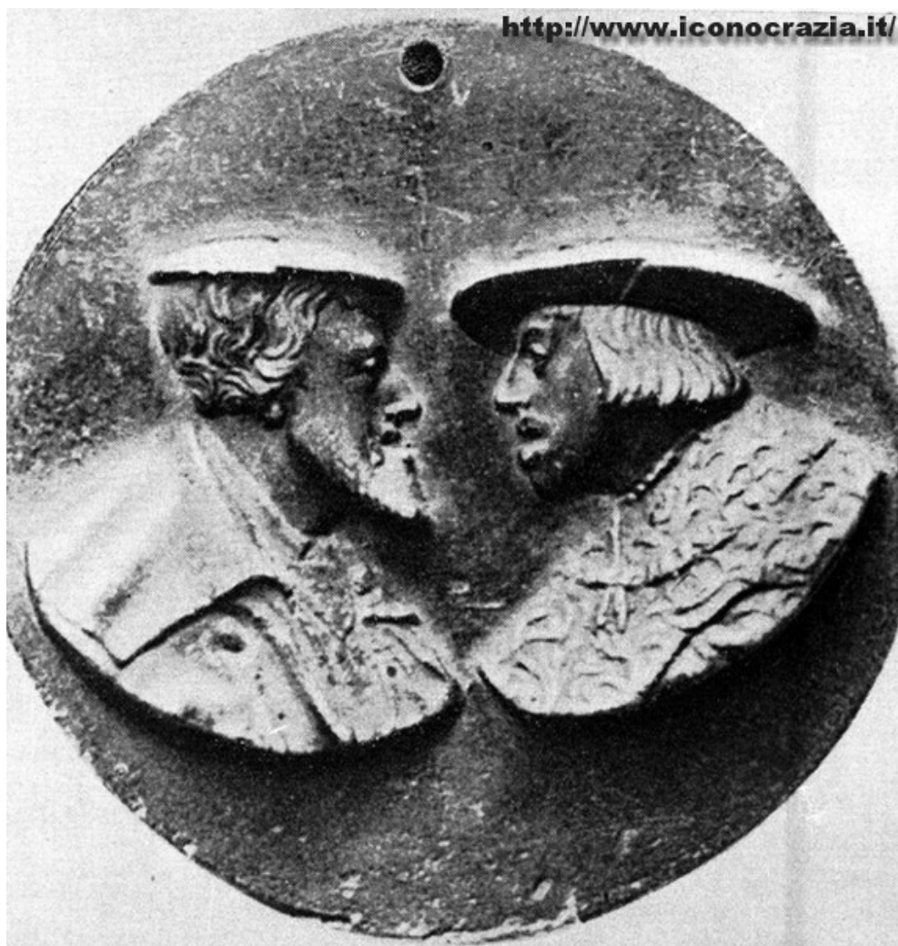
Figura 09. Doppio ritratto di Carlo V e Ferdinando I