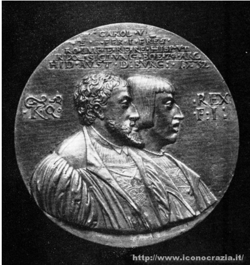
Figura 016. Ferdinando I e Carlo V (n/n). Medaglia di veit Kels o Hans Kels (1536)

5. Nel quinto tipo ho raggruppato alcune rappresentazioni di Carlo V e di suo figlio Filippo II. I due monarchi sono sempre rappresentati 'collo a collo'. Il significato di questa rappresentazione simbolica sta nel fatto che l'abdicazione di Carlo Quinto, avvenuta nel 1556, a favore del figlio Filippo II sancisce in modo definitivo il passaggio da un potere imperiale monocentrico che coinvolgeva tutto il mondo cristiano, ed era basato sull'investitura spirituale, a un potere policentrico, basato sul potere del monarca su un determinato territorio fondato sulla successione dinastica di padre in figlio.