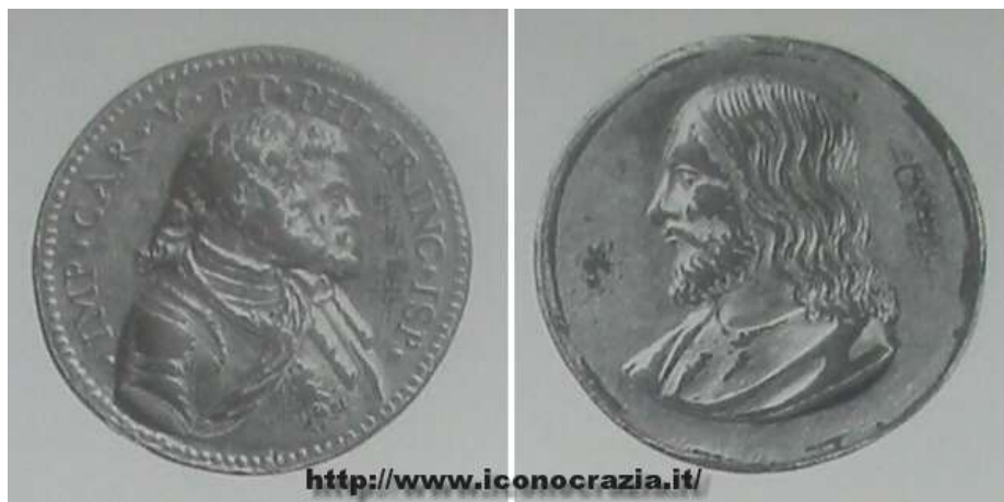
Figura 019. Carlo V e Filippo II di Spagna (dritto) e Gesù Cristo (rovescio) Medaglia in bronzo argentato e dorato (seconda metà XVI sec. ?) copia in fusione di medaglia di Leone Leoni

La prima immagine che vediamo è una medaglia, che mostra sul dritto lo stesso gruppo di Carlo Quinto e Filippo Secondo che abbiamo visto nella medaglia precedente. Ma il rovescio riproduce il volto di Gesù Cristo.