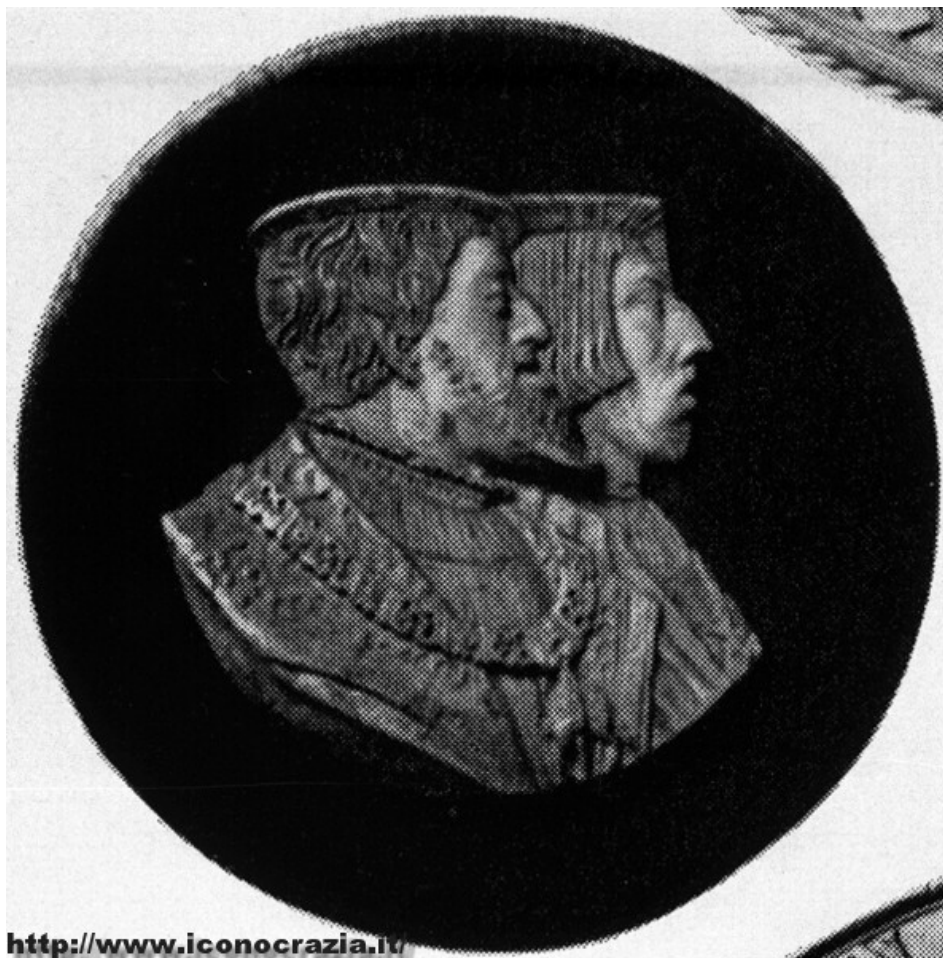
Figura 015. Doppio ritratto di Carlo V e Ferdinando I (n/n). Medaglia di Peter Floetner 1532