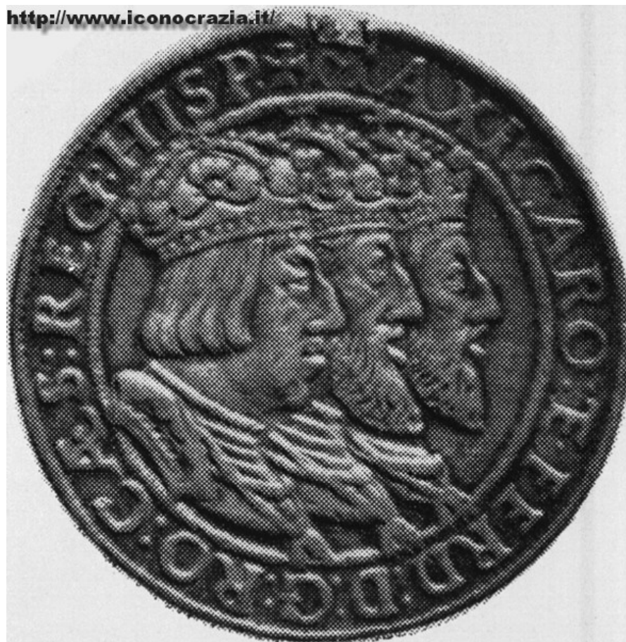
Figura 06. Drei Kaiser Taler (n/n) Medaglia anonima (1558)