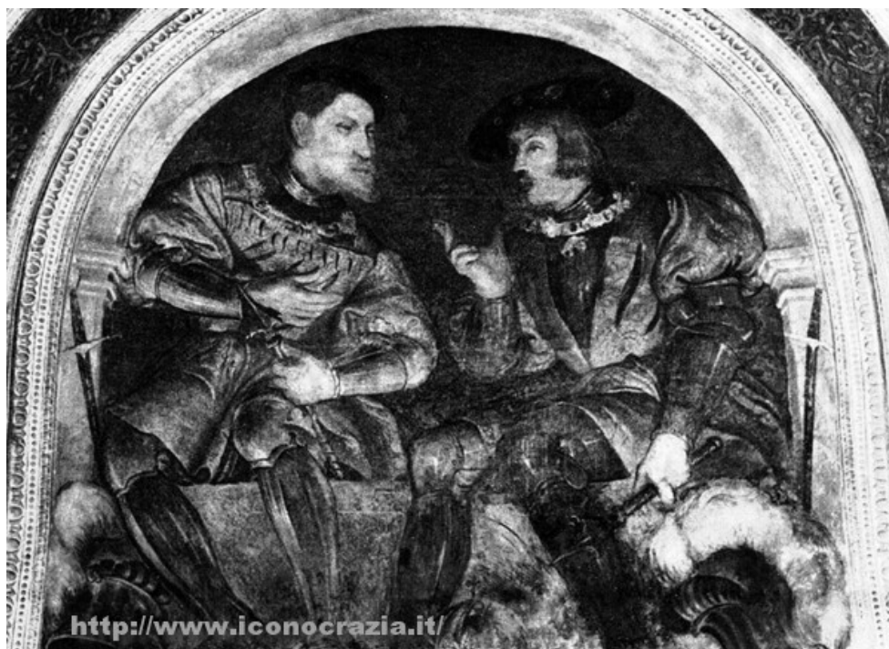
Figura 011. Carlo V e Ferdinando I. Affresco di Girolamo Romanino (1531)