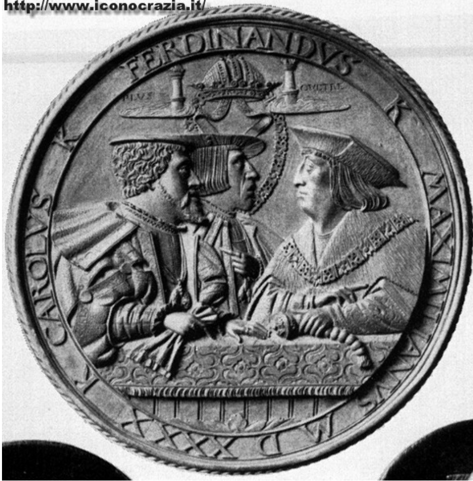
Figura 05. Medaglia con Massimiliano I, Carlo V e Ferdinando I (f/f) (n/n) Medaglia di Hans Kels (1540)

Nelle figure numero 06 (1558) e 07 (1536) le figure dei tre imperatori sono ‘collo a collo’. Nel primo caso l'organizzazione spaziale della medaglia imita lo stile romano (ricorda la medaglia della figura 02); al contrario, nella seconda medaglia lo stile è più simile a quello delle medaglie di stile tedesco, in particolare ricorda la figura 05.