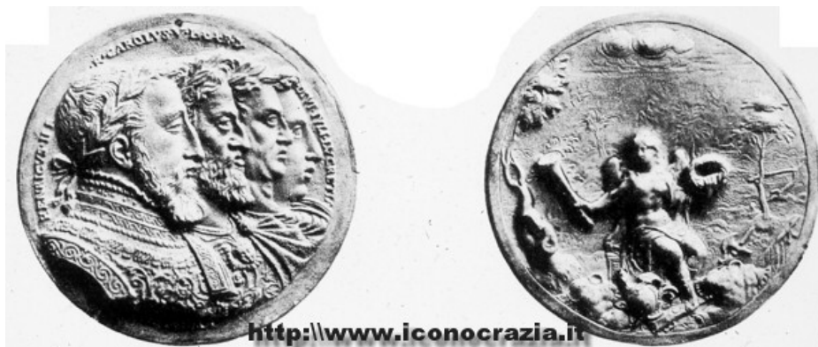
Figura 02. Gruppo all'uso romano (1537)

Nella figura numero 02 (1537), il gruppo rappresentato è composto da Enrico II, Carlo I, Cesare e Lucrezia e la rappresentazione è 'alla romana': imita un uso romano che crea linee di continuità non solo di sangue, ma anche basate sulle somiglianze politiche tra i personaggi.