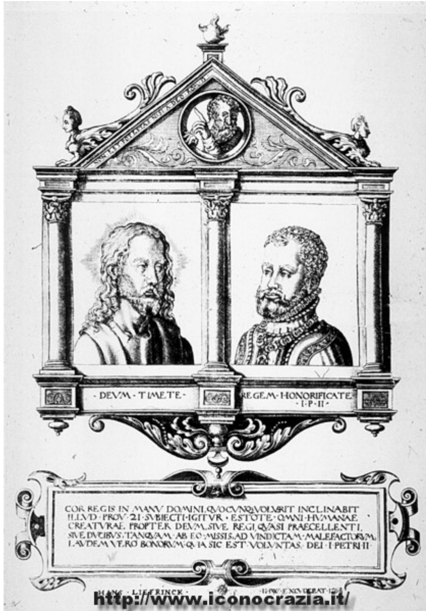
Figura 20. Gesù Cristo e Filippo II (f/f) incisione di Hans Liefrinck presso la bottega di H. Wierix (1568)

In questo modo, infine, la retorica del potere statale moderno afferma definitivamente il carattere autoreferenziale dello Stato moderno, che diventa un'istituzione onnicomprensiva e non può avere alcun fondamento esterno se non la diretta investitura divina.