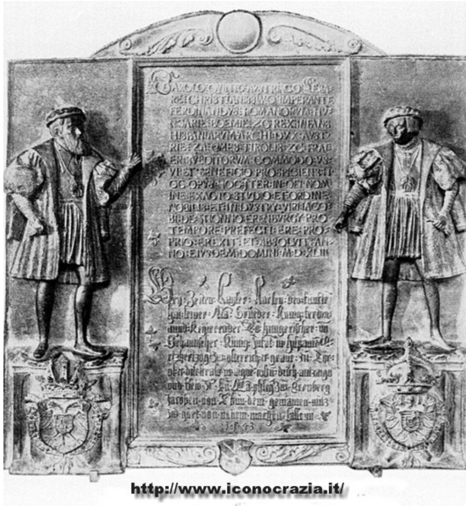
Figura 014. Cippo stradale Ferdinando I, Carlo V (f/f). Bassorilievo di Vit Arnperger (1543)

Rispetto a queste raffigurazioni, le figure numero 15 (1532) e numero 16 (1536) sono molto diverse. In questi casi le due figure sono ‘testa a testa’, con un'evidente prevalenza iconografica a favore di Carlo Quinto, sottolineata nella seconda medaglia dai titoli di Imperatore e Rex.