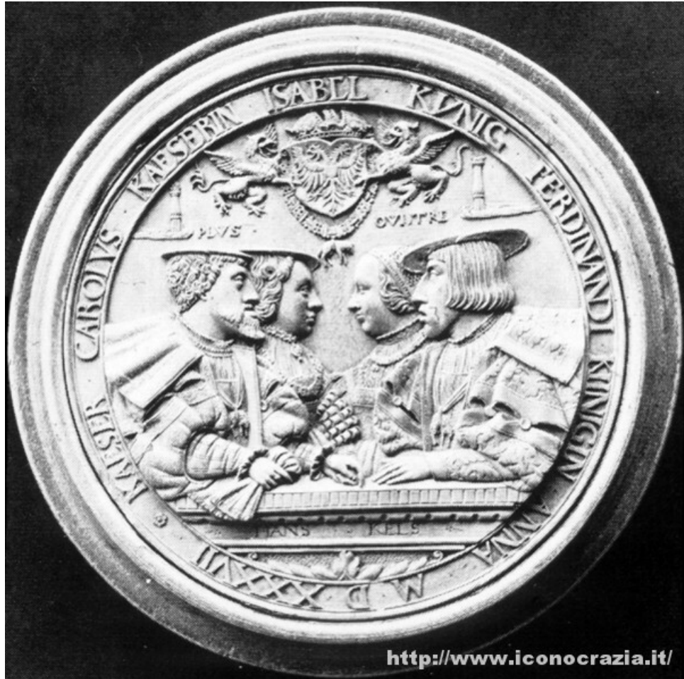
Figura 010. Carlo V e Ferdinando I con le mogli

Nelle figure 11, 12, 13 (1531, 1550, 1543), vi è una completa equivalenza simbolica tra i due fratelli, e anche nella figura 14 (1527), vi è una sostanziale parità, anche se in questo caso è enfatizzata dal carattere di fratellanza della cavalleria. In tutti questi casi il trait-d'union è la comune appartenenza all'ordine del Toson d'Oro, appartenenza sottolineata dalla presenza del collare con la pelliccia di montone appesa.