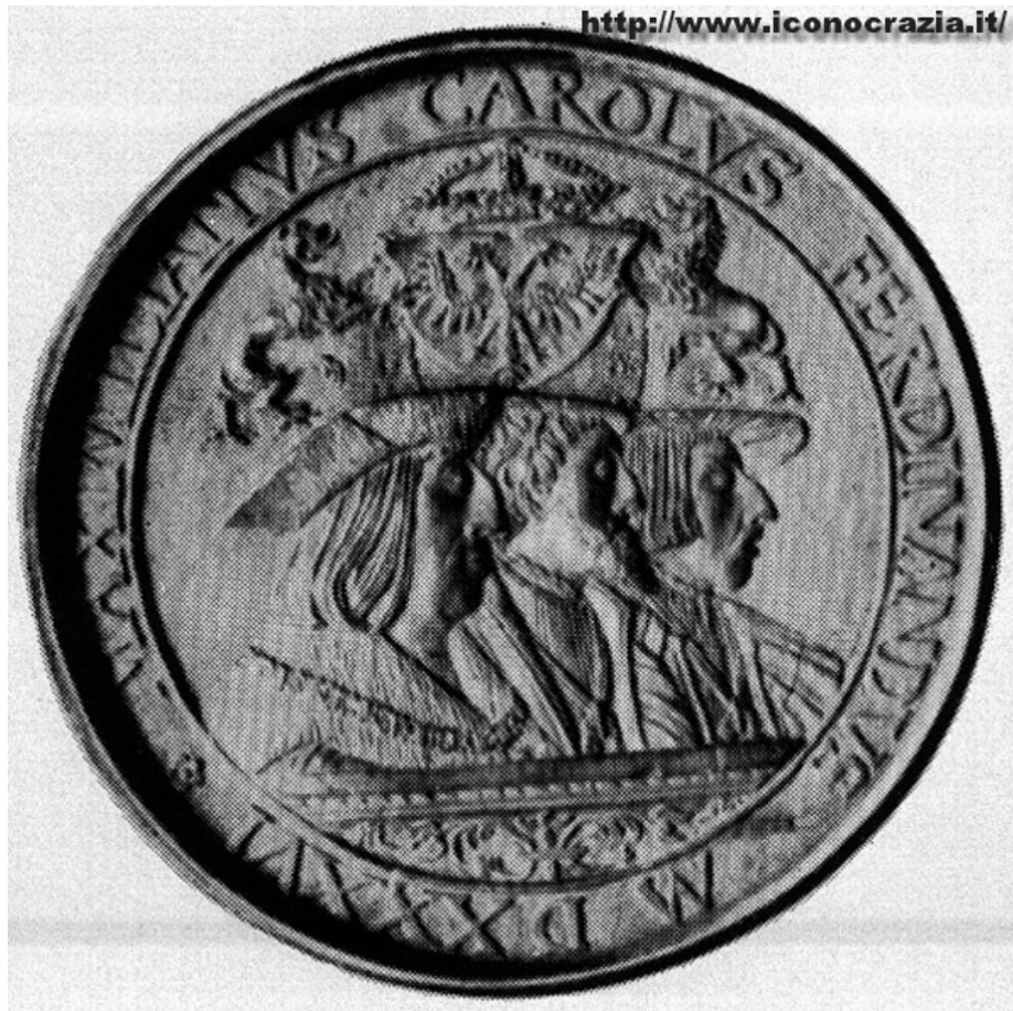
Figura 07. Medaglia con Massimiliano I, Carlo V e Ferdinando I (n/n) Medaglia di Veit Kels (1536)

4. Nel quarto tipo ho raggruppato i ritratti accoppiati di Carlo Quinto e Ferdinando Primo. In questo caso, sette elementi figurativi su nove selezionati sono ‘faccia a faccia’ e solo gli altri due sono ‘collo a collo’, a dimostrazione del fatto che l'enfasi iconografica, nella rappresentazione dei due fratelli, è posta su alcuni elementi simbolici che li pongono entrambi su un piano di sostanziale equivalenza, pur con una leggera prevalenza (anche cronologica) di Carlo Quinto.