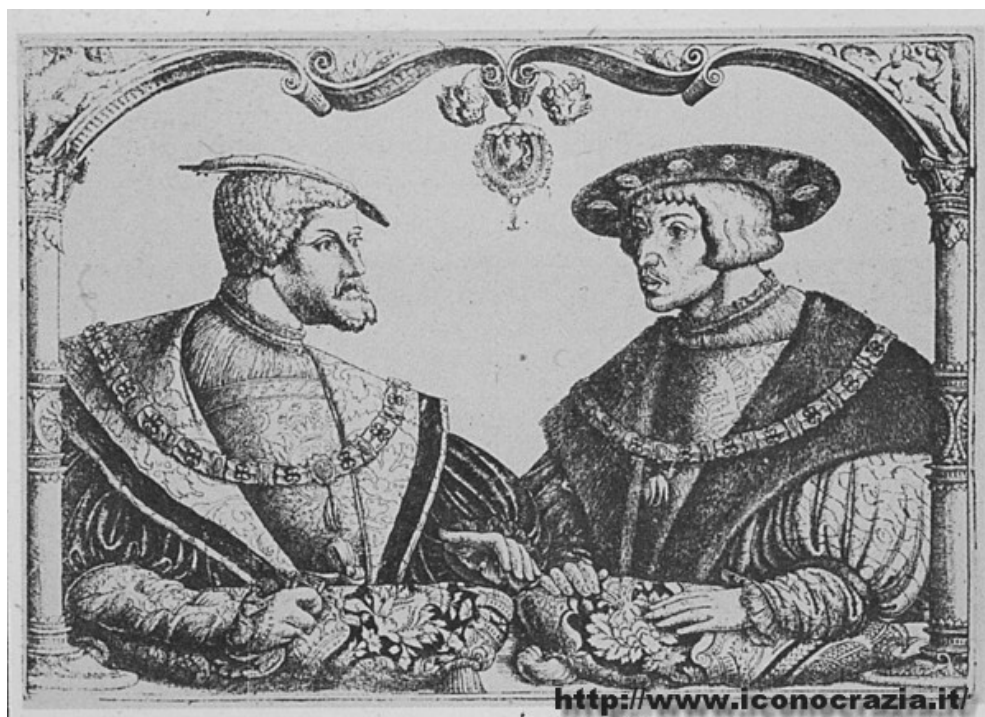
Figura 013. Carlo V e Ferdinando I (f/f) Xilografia di CB (metà del XVI sec.)