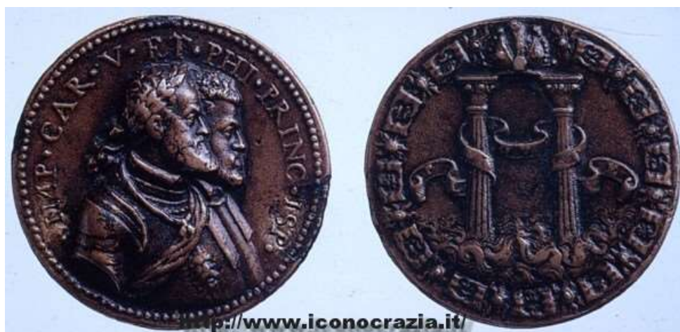
Figura 018. Carlo V e Filippo II di Spagna, Medaglia in bronzo (1550) di Leone Leoni